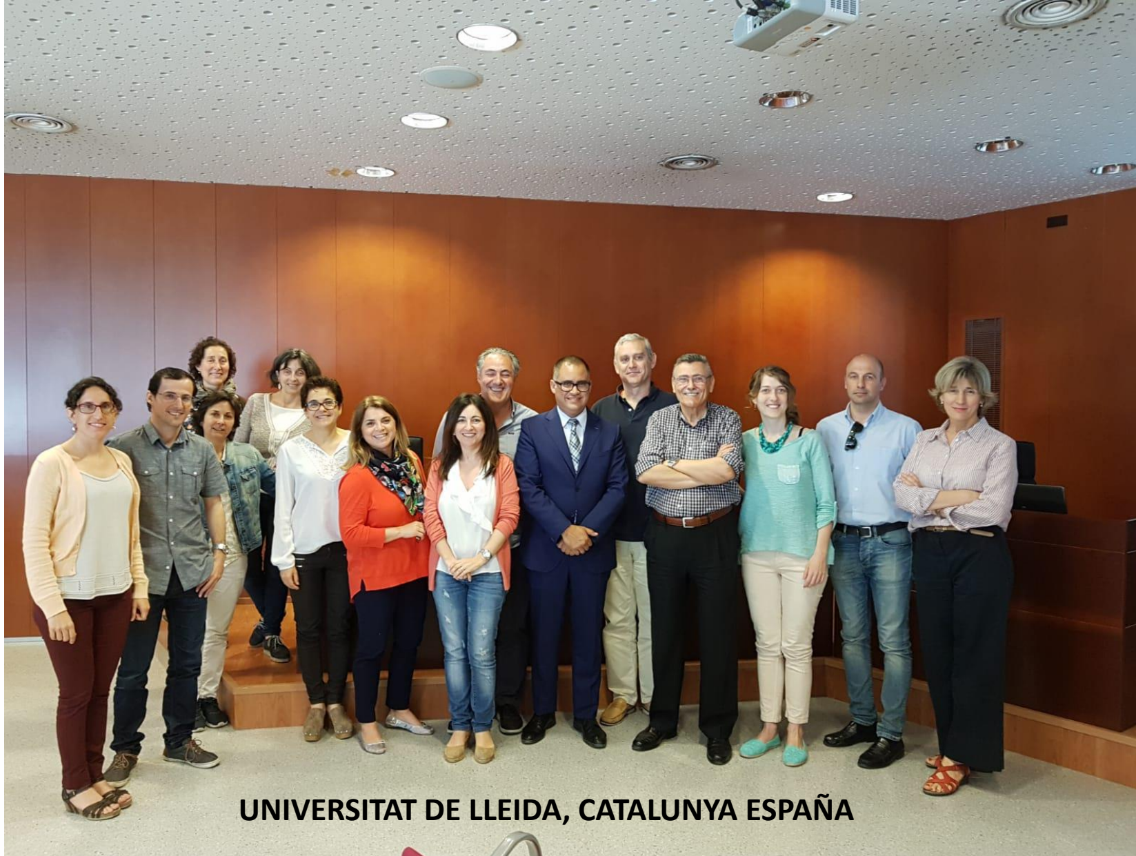
UNIVERSITAT DE LLEIDA, CATALUNYA ESPAÑA