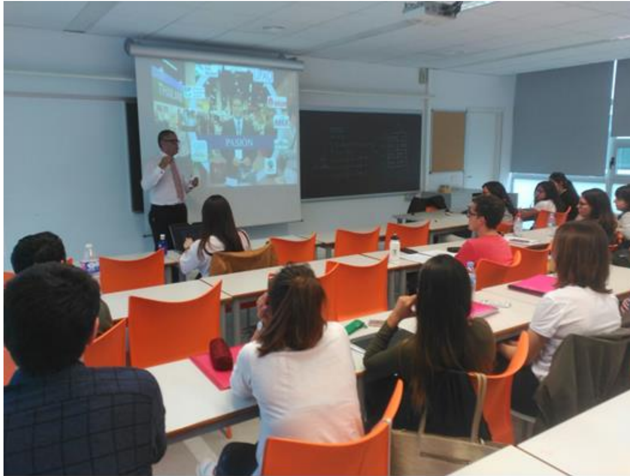
Dictado de clases en el curso de Empresas Familiares, programa de Administración, Universitat de Lleida, España, mayo 2018