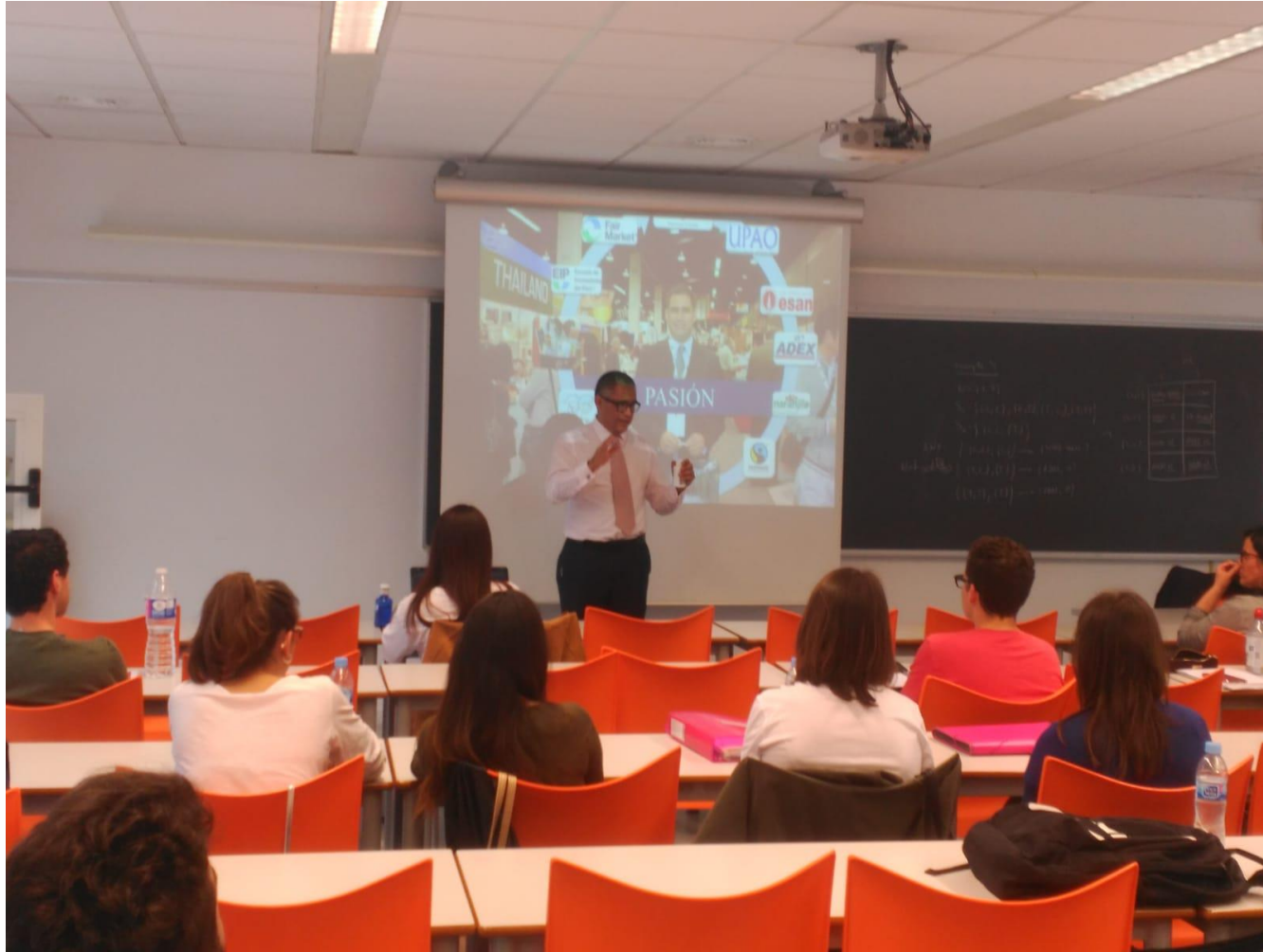
Dictado de clases en el curso de Empresas Familiares, programa de Administración, Universitat de Lleida, España, mayo 2018