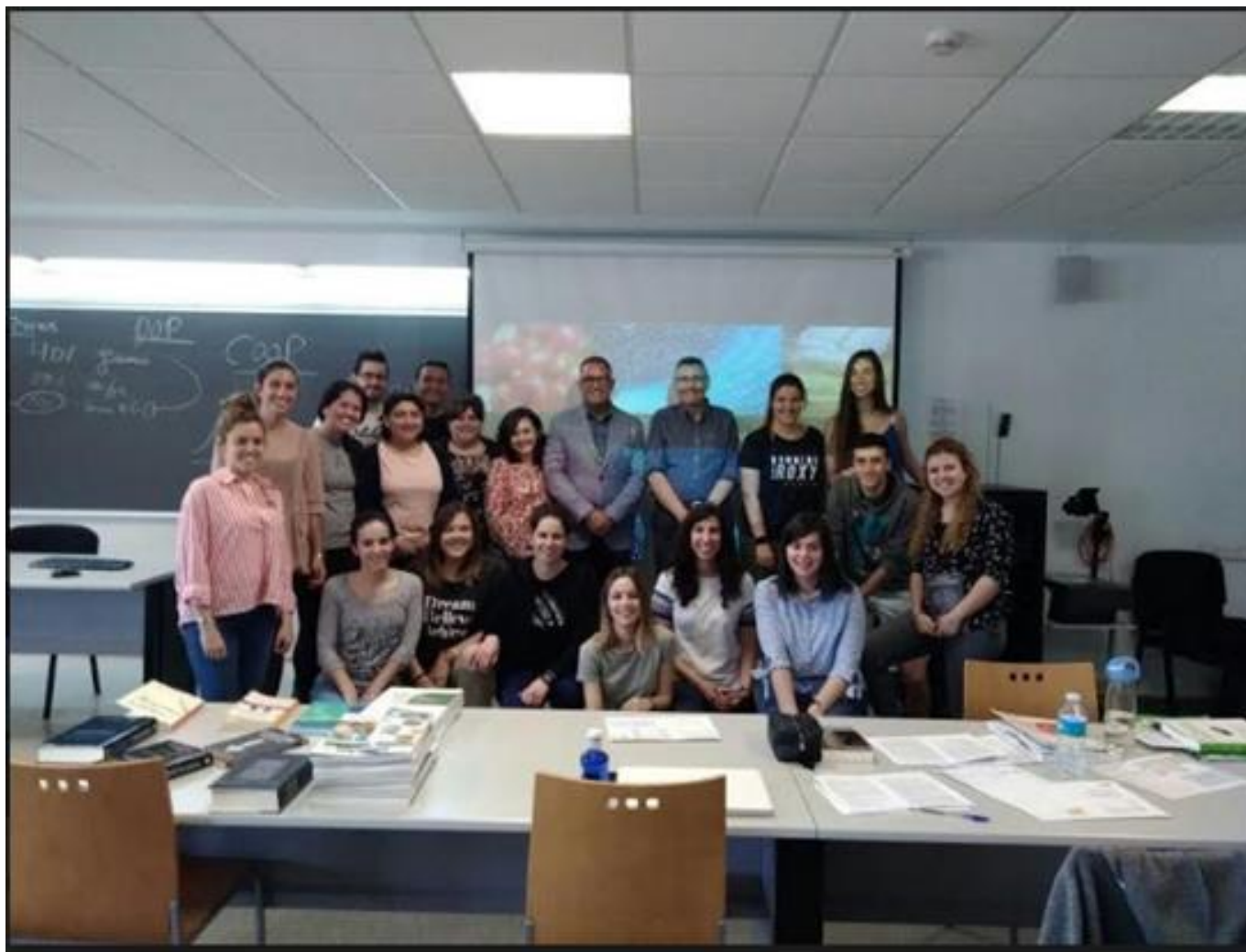
Dictado de clases en el curso de innovación de la Maestría de Agroalimentos, Universitat de Lleida, España, mayo 2018