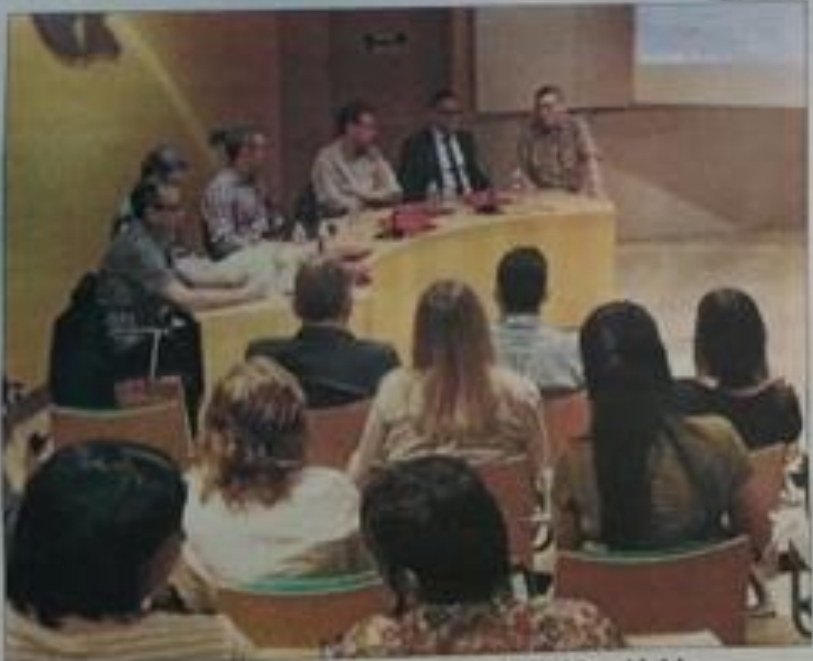
La taula redona sobre innovació empresarial, ahir, a Lleida.

el dèficit en un 3,7%, fins als 6.933,4 milions gràcies a les exportacions, que van marcar màxims i van arribar als 71.024,7 milions.